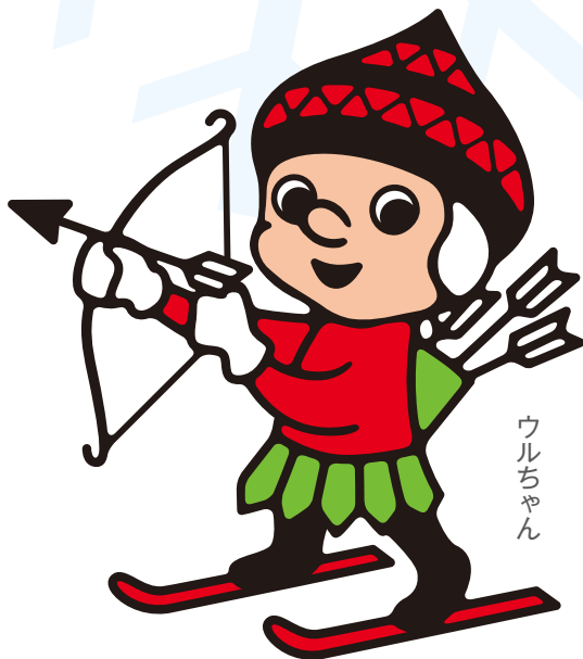
キッズ チャレンジスキー 公式キャラクター