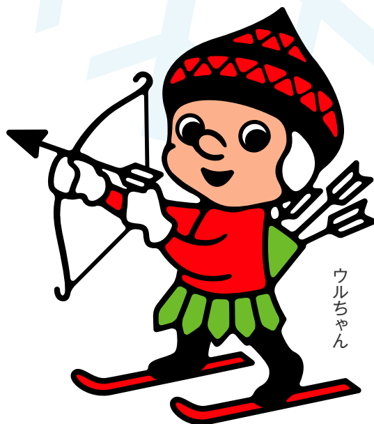
キッズ チャレンジスキー 公式キャラクター